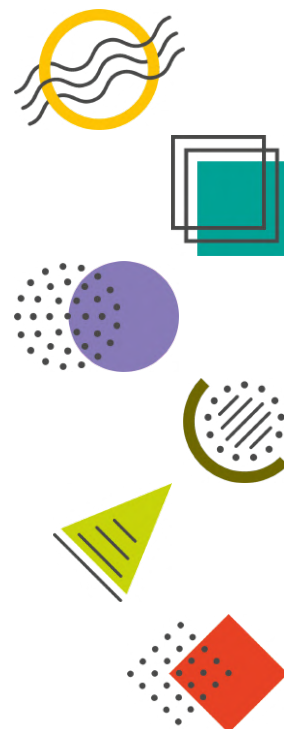
Logos des 6 Portes ( Manuel de la Grande Transition )

En particulier, les équipes du Campus utilisent la méthodologie des 6 portes issue du Manuel de la Grande Transition , pour proposer une approche inter- et trans-disciplinaire avec 6 angles différents qui ouvrent sur les enjeux de la transition depuis une perspective particulière (celle des sciences dites « dures », des sciences humaines et sociales, des sciences de gestion, du droit...). Cette démarche vise à décloisonner les savoirs et les savoir-faire, ainsi qu'à valoriser le débat et le dialogue entre les rationalités à l'œuvre, les cultures et les différentes visions du monde qui se côtoient.