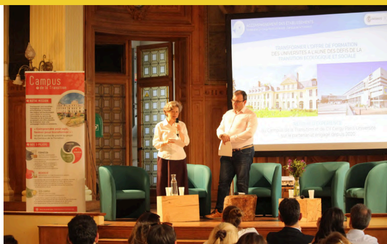
Soirée de restitution (Académie du Climat, 25/05/2023)

L'année 2023 a également été marquée par la publication d'un rapport de retour d'expérience des deux premières années d'accompagnement de Cergy , ainsi qu'un événement de présentation pour promouvoir sa diffusion auprès des institutions.