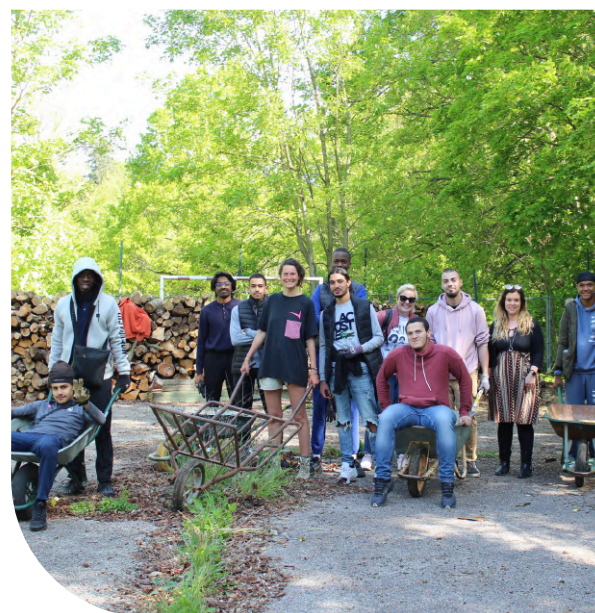
Stage « Vivre ensemble la transition » (Forges, 05/2023)

« J'ai adoré les activités et les ateliers. J'ai découvert beaucoup sur l'écologie mais également sur moi-même . J'ai aimé dialoguer avec l'ensemble des habitants du Campus. Je remercie nos animateurs et les élèves de l'ESSEC »